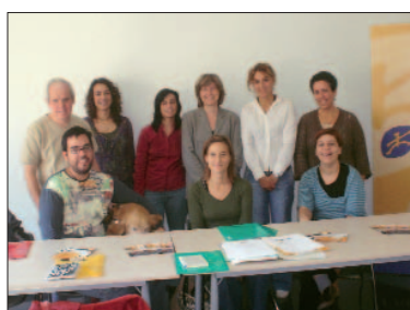
■ Firma del acuerdo entre el centro educativo y las entidades en septiembre pasado.

En octubre pasado, al iniciarse el curso 2007-2008, desde el "Punt