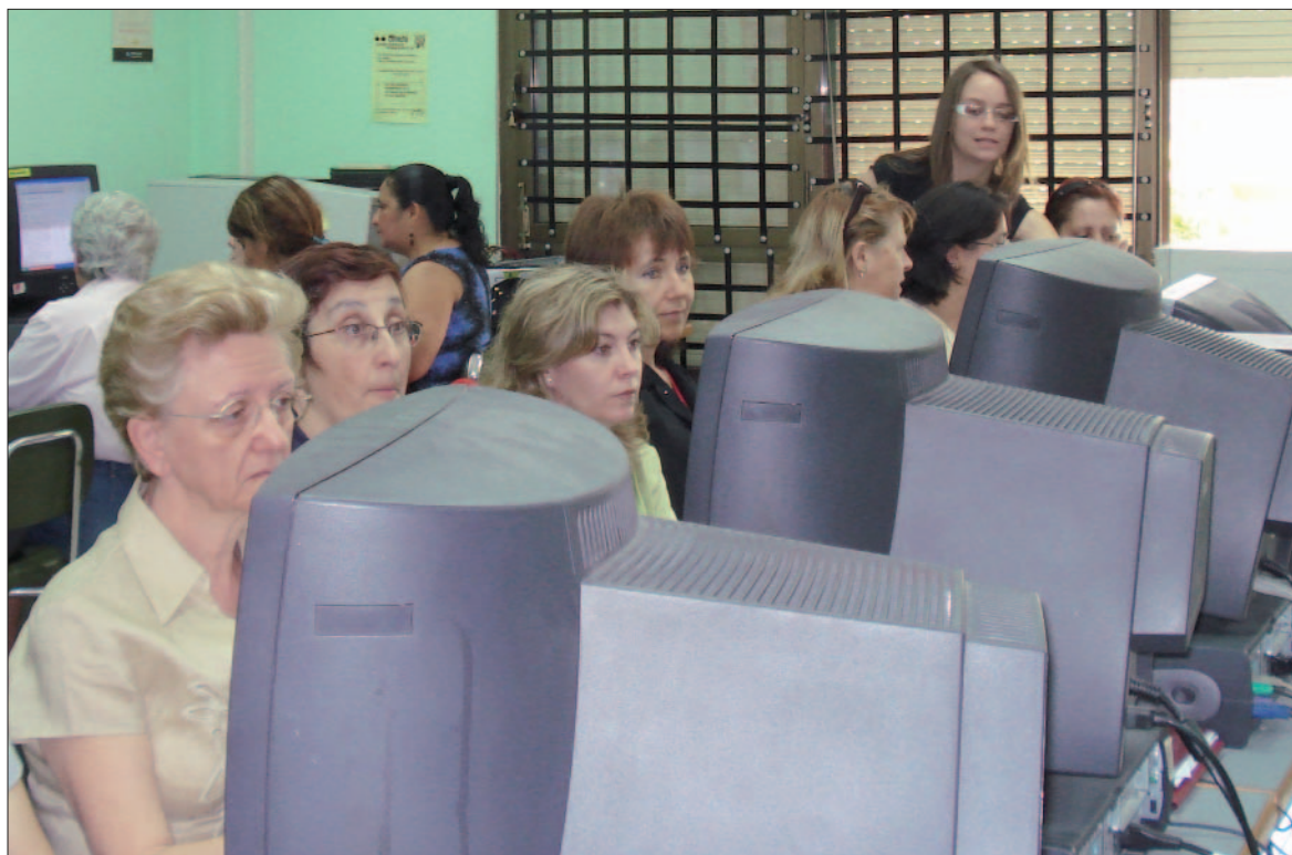
■ Las personas mayores son uno de los colectivos que m s utilizan el aula Red Conecta.

La Asociaci n Vecinal "La Cornisa" trabaja entorno a seis ejes de acci n para toda la poblaci n del barrio: Formaci n y Empleo; Servicios de orientaci n y ayuda mutua; Infancia y Juventud; Ocio y cultura;